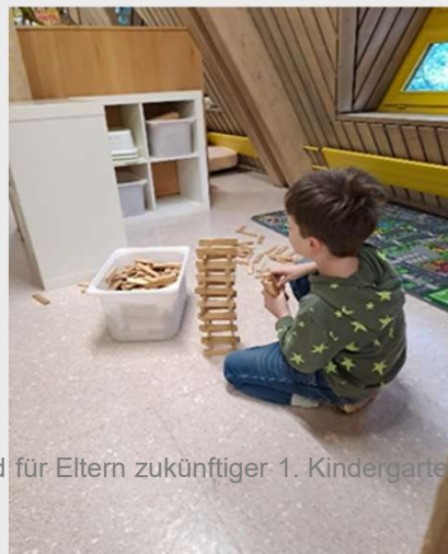
PSW Orientierungsabend für Eltern zukünftiger 1. Kindergartenkinder 21.01.2026