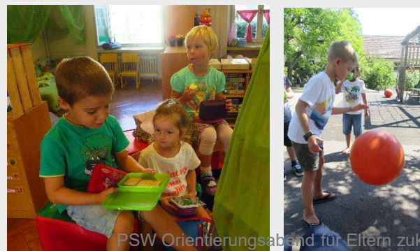
Znüni / Pause